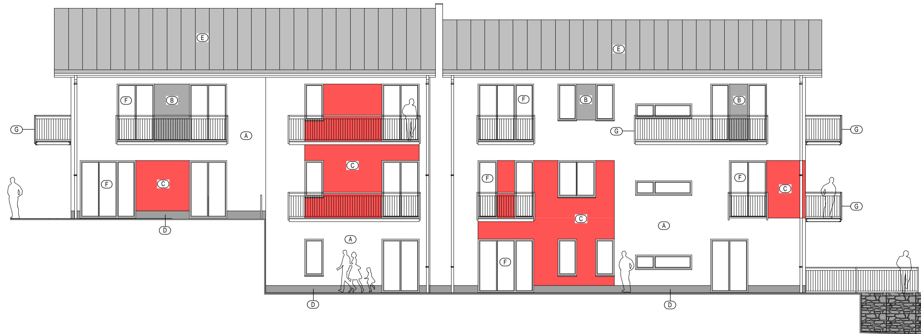
POHLED ZÁPADNÍ M 1:100